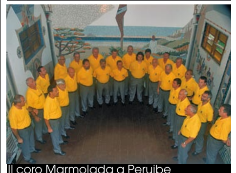
Il coro Marmolada a Peruibe

Anche quest'anno il Coro Marmolada dedicherà alcuni concerti di Natale ai bambini della Colonia Venezia.