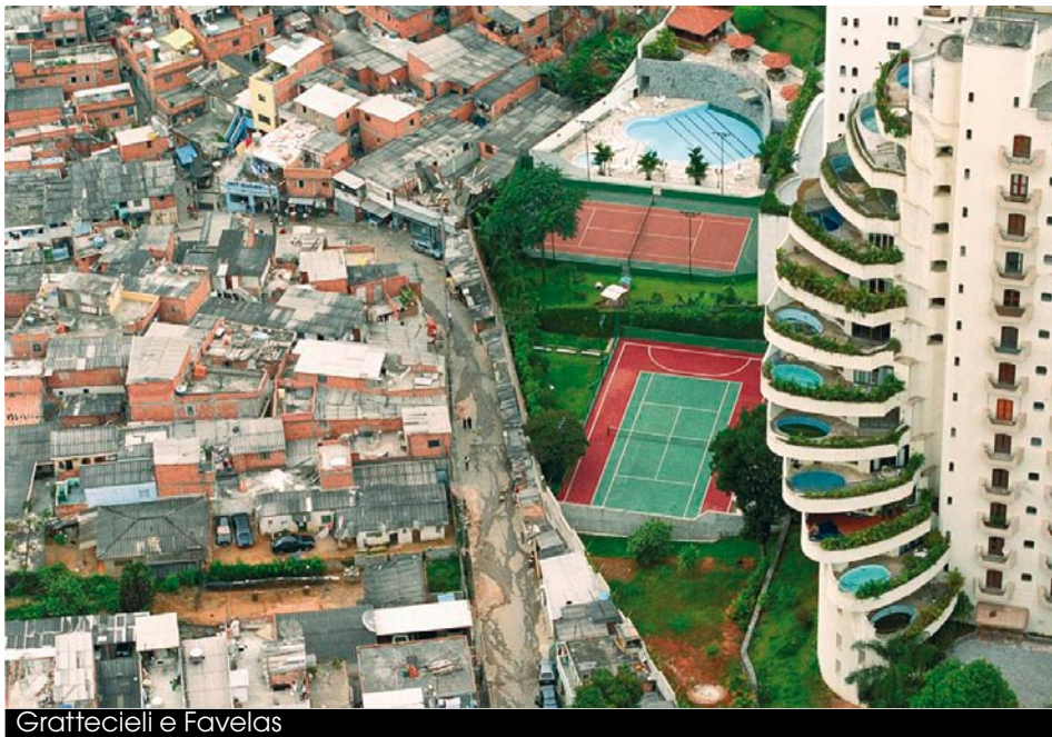
Gratificeli e Favelas