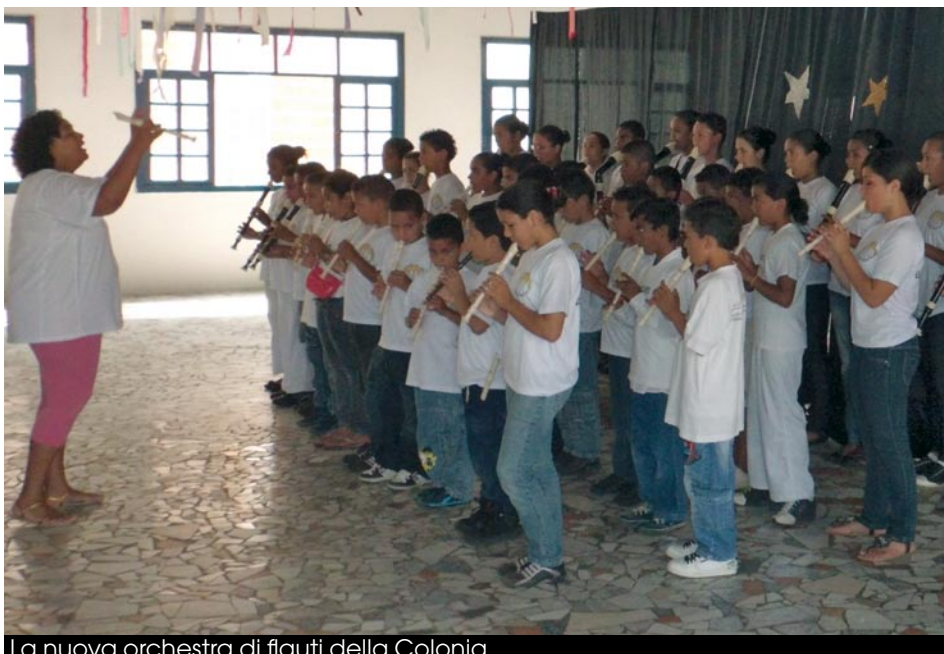
La nuova orchestra di flauti della Colonia