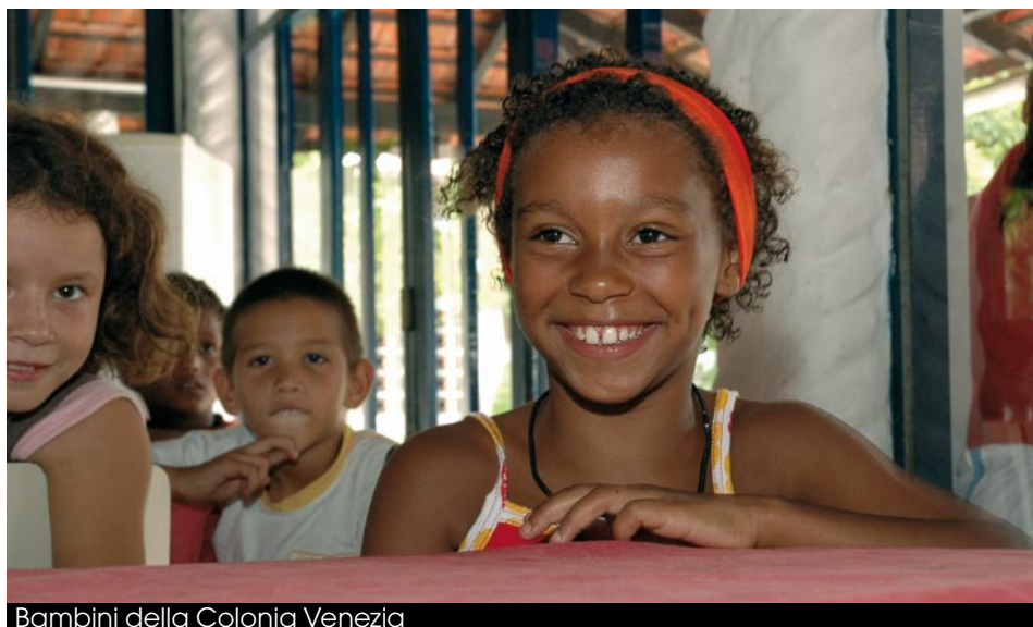
Bambini della Colonia Venezia