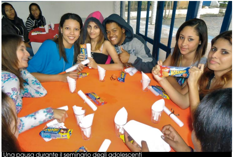
Una pausa durante il seminario degli adolescenti